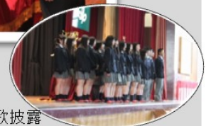
生徒有志による校歌披露